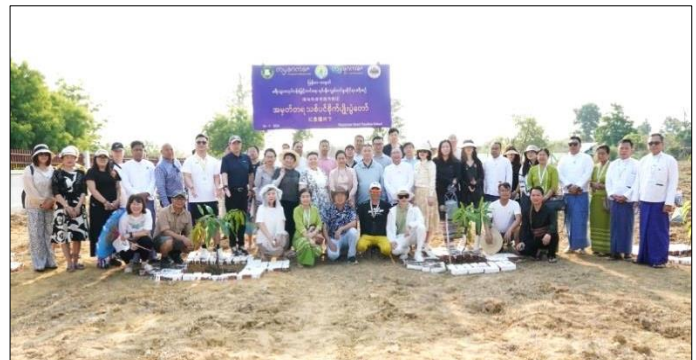
မြန်မာ-တရုတ် ခရီးသွားမြှင့်တင်ရေး ရင်းနှီးကျွမ်းဝင်မှုဆိုင်ရာခရီးစဉ် (Familiarization Trip- FAM Trip) တွင် လိုက်ပါလာကြသည့် ကိုယ်စားလှယ်များသည် မေလ ၁၆ ရက်နေ့ နံနက်ပိုင်းတွင် ပြည်ထောင်စုနယ်မြေ နေပြည်တော်ဟိုတယ်လုပ်ငန်းဆိုင်ရာ သင်တန်းကျောင်း၌ အမှတ်တရသစ်ပင်များ

စိုက်ပျိုးကြရာ ဟိုတယ်နှင့်ခရီးသွားလာရေးဝန်ကြီးဌာန ပြည်ထောင်စုဝန်ကြီး ဒေါက်တာသက်သက်ခိုင်၊ အမြဲတမ်းအတွင်းဝန်၊ ညွှန်ကြားရေးမှူးချုပ်နှင့် အရာရှိကြီးများ၊ နေပြည်တော်ဟိုတယ်ဆိုင်ရာ လုပ်ငန်းရှင်များအသင်းနှင့် ခရီးသွားလုပ်ငန်းရှင်များအသင်းတို့မှ ဥက္ကဋ္ဌများနှင့် တာဝန်ရှိသူများ၊ ဟိုတယ်များမှ တာဝန်ရှိသူများက သွားရောက်ကြည့်ရှုအားပေးကြသည်။