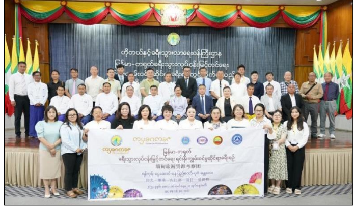
ယင်းနောက် ပြည်ထောင်စုဝန်ကြီးနှင့် ဒုတိယဝန်ကြီးတို့က ရင်းနှီးကျွမ်းဝင်မှု ဆိုင်ရာ ခရီးစဉ် (FAM Trip) တွင် လိုက်ပါခဲ့ကြသည့် ကိုယ်စားလှယ်များကို

အမှတ်တရလက်ဆောင်ပစ္စည်းများ ပေးအပ်ကာ စုပေါင်းမှတ်တမ်းတင်ဓာတ်ပုံ ရိုက်ကြပြီး Grand Amara Hotel ၌ ညစာစားပွဲဖြင့် တည်ခင်းဧည့်ခံသည်။ အဆိုပါအဖွဲ့တွင် ခရီးသွားလုပ်ငန်းနှင့်ဆက်စပ်ဌာနများ၊ ခရီးသွားအေဂျင်စီ များနှင့် မီဒီယာများပါဝင်ပြီး ၎င်းတို့အဖွဲ့အနေဖြင့် ရန်ကုန်၊ ငွေဆောင်တို့သို့ သွားရောက်လည်ပတ်ခဲ့ကာ နေပြည်တော်၊ ပုဂံ၊ မန္တလေးတို့ရှိ ခရီးသွားဆွဲဆောင် ရာ နေရာများသို့ ဆက်လက်သွားရောက်လည်ပတ်ကြမည်ဖြစ်ပါသည်။