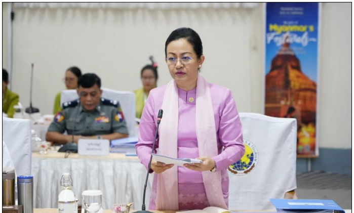
ထိုနေ့က အမျိုးသားခရီးသွားလုပ်ငန်းဖွံ့ဖြိုးတိုးတက်ရေး ဗဟိုကော်မတီ ဒုတိယဥက္ကဋ္ဌ ဟိုတယ်နှင့်ခရီးသွားလာရေးဝန်ကြီးဌာန ပြည်ထောင်စုဝန်ကြီး ဒေါက်တာသက်သက်ခိုင်က ခရီးသွားလုပ်ငန်းဆိုင်ရာများနှင့်စပ်လျဉ်း၍ ဆွေးနွေးတင်ပြသည်။