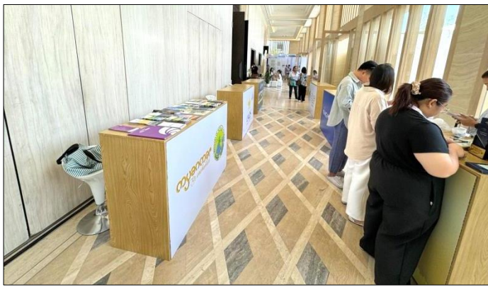
မြန်မာနိုင်ငံခရီးသွားလုပ်ငန်း ဈေးကွက်မြှင့်တင်ရေးအသင်းတို့မှ အသင်းဝင် ခရီးသွားကုမ္ပဏီ (၃)ခုတို့ ပါဝင်ပြသခဲ့ပါသည်။

ထိုင်းခရီးသွားလုပ်ငန်းအာဏာပိုင်အဖွဲ့ (The Tourism Authority of Thailand - TAT) သည် Phang-nga ပြည်နယ်၊ ခရီးသွားလုပ်ငန်းဆိုင်ရာ အသင်းအဖွဲ့များနှင့် ပူးပေါင်း၍ ထိုင်းနိုင်ငံ Phang-nga ပြည်နယ်၊ JW Marriott Khao Lak Resort and Spa ၌ ၅-၆-၂၀၂၄ ရက်နေ့မှ ၇-၆-၂၀၂၄ ရက်နေ့အထိ ကျင်းပပြုလုပ်ခဲ့သည့် ထိုင်းခရီးသွားပြပွဲ -၂၀၂၄ (Thailand Travel Mart Plus 2024) သို့ မြန်မာနိုင်ငံခရီးသွားလုပ်ငန်းရှင်များအသင်းနှင့်